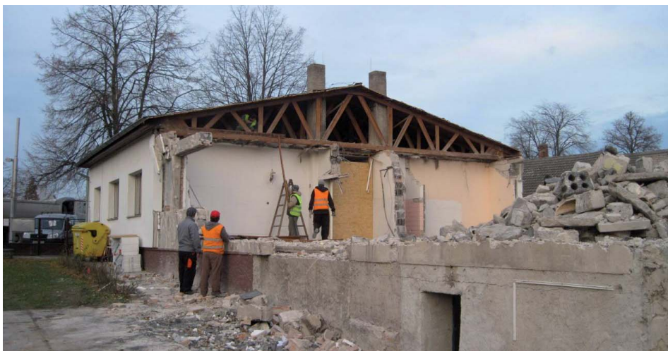
Původním záměrem projektu byla kompletní stavba propojených objektů mateřské školy a obecního úřadu v jednom funkčním celku. Ve finále byla realizována pouze rekonstrukce MŠ a objekty se konstrukčně oddělily. Tudiž se změnila hranice původního projektu. Zhotovitel stavby, společnost CGM Czech a.s.

Celou akci jsme brali velmi zodpovědně a chtěli jsme za daných podmínek připravit pro děti to nejlepší. Na počátku jsme objížděli nově zrealizované projekty mateřských škol v kraji, abychom se inspirovali. Podařilo se nám takto vyvarovat zbytečných chyb. Dostali jsme například tip, že clony mezi jed-