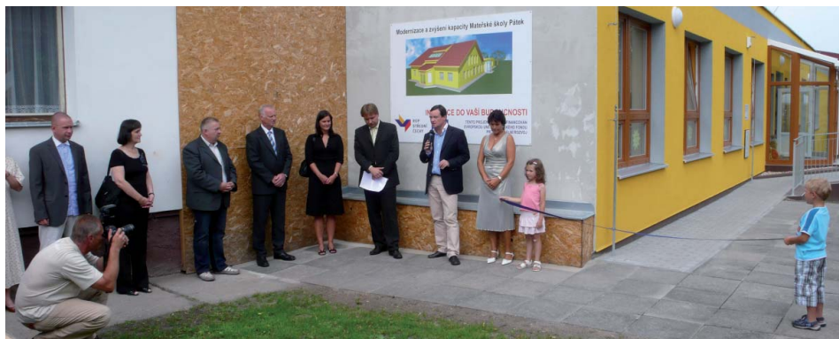
Na této fotografii, slavnostního otevření v srpnu 2011, je vidět oddělení nové od staré budovy. Při této příležitosti do Pátku přijel hejtmán Středočeského kraje MUDr. David Rath.

se pověsí zmoklé nebo přeprané šaty. Školka má dvě oddělení – pro mladší a starší děti a zvláštní místnost pro spaní. Díky tomu se nemusí denně rozkládat lůžka. To je klidné místo, kde mohou menší děti odpočívat, zatímco si starší děti hrají v hlavní místnosti. Mysleli jsme i na zázemí pro personál. Je jím převlékárna pro paní kuchařku, sklady na zeleninu se škrabkou na brambory a sběračem škrabu, sklad na maso. Paní kuchařka je s novou kuchyní velmi spokojená. Dříve měla obyčejný sklokeramický sporák a malou, domácí kuchyň, kdežto nyní vládne naprosto profesionálnímu zařízení. Zvykla si již obsluhovat efektivní horkovzdušnou troubu – Convectomat. Má dvě příruční lednice vzhledem k novým normám – maso a vejce musí být odděleně od ostatních potravin. Plánovali jsme velkou sklokeramickou desku se sklopnou, závěsnou pánví, ale na doporučení výrobce jsme koupili raději velkokapacitní hořáky s klasickou troubou, které jsou vhodnější pro menší stravovací provoz. Jídlo pomáhá připravovat nový hnětací stroj, nádobí čistí myčka s tlakovou mycí sprchou a slouží tu ještě další užitečné vybavení. Do projektu byla zahrnutá i místnost, kde se konají různé kroužky. V suterénu našli své místo kotelna, sklad a garáž. Kotelnu jsme obohatili o jednu investici navíc – s výhledem k budoucím možným zdrojům energie. Je to stoupačka na napojení na možný solární ohřev vody. Zahrada zůstala zatím jako volná, travnatá plocha bez herních prvků.“