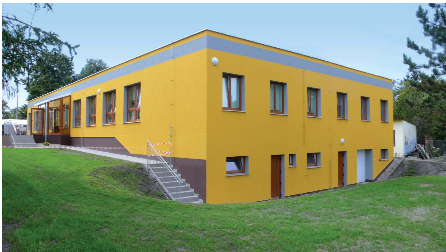
Podobu nové školce vtisknul Leoš Piroutek z Poděbrad.

Cílem bylo vybudování nové budovy mateřské školy o kapacitě 40 míst splňující všechny v současnosti platné normy v oblasti hygienické a technické. V průběhu realizace, ale došlo k nečekanému překvapení. Měli jsme v původním projektu totiž také modernizaci obecního úřadu. Do projektu však vstoupila analýza rizik kontaminace podzemních vod a možného